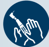
Control y mantenimiento